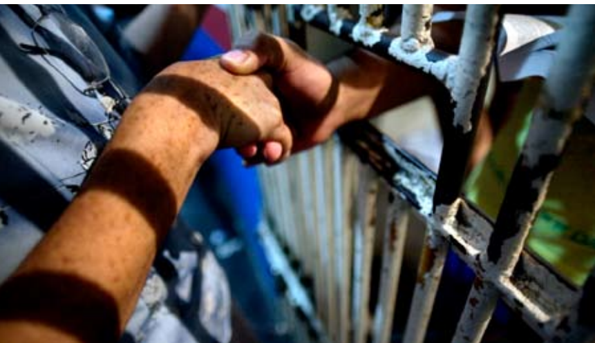
Grupo presta atendimento religioso a jovens em regime de internação no sistema socioeducativo. Unidade Daguiamar Feitosa, Manaus, AM.

“Na ausência de regulamentação de como deve operar a assistência religiosa no cotidiano das unidades, a interpretação da lei está sujeita a diferentes entendimentos e interpretações”, explica. Para ele, as atividades de assistência religiosa devem ser conduzidas de acordo com os princípios de um Estado democrático e laico. ■