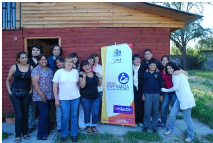
Equipe do Projeto Estación Esperança conseguiu reduzir taxa de reincidência criminal dos jovens beneficiados que hoje é de 17%.

Primeiro é feito um diagnóstico que estabelece o índice de vulnerabilidade do adolescente e suas potencialidades. O segundo passo é a intervenção, cujas características são determinadas a partir de cada caso. Por fim, é feito o acompanhamento e o fechamento do processo onde é feita uma avaliação do cumprimento das metas fixadas no plano de intervenção individual elaborado para o/a jovem. ■