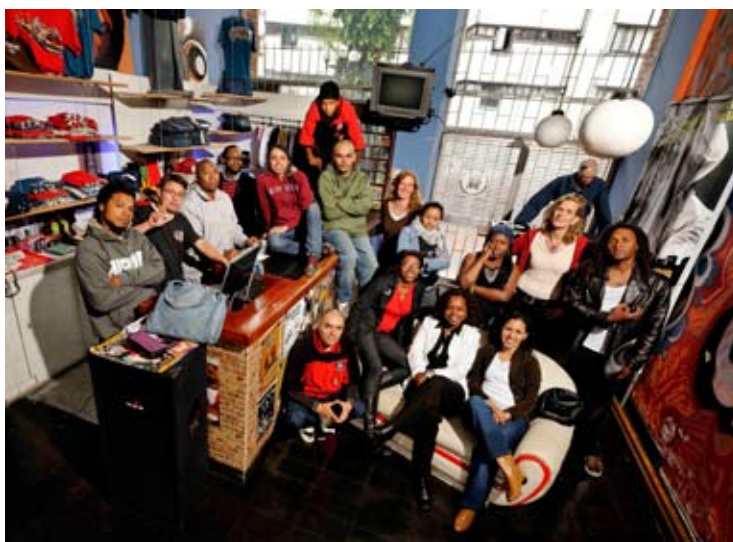
Fundação Artística e Social da Família Ayara forma jovens líderes utilizando elementos da cultura hip hop.

Potencializar os processos organizativos, a capacidade de incidência política e o potencial de mobilização social de líderes