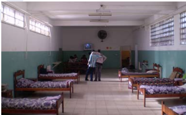
Adolescentes ficam internados em regime fechado no Instituto San Martín, na Argentina.

Drogas e delinquência juvenil são questões que costumam ser jogadas no mesmo saco, sem que se saiba com clareza qual é a relação entre elas. Para estabelecer os padrões de uso de drogas entre crianças e adolescentes em conflito com a lei e entender suas causas e consequências, um grupo de integrantes do Programa de Assistência e Pesquisa sobre Dependência da Secretaria Nacional da Infância, Adolescência e Família da Argentina, realizou o “Estudo sobre perfis sociais e padrões de consumo de substâncias psicoativas em adolescentes residentes em dispositivos de regime fechado”.