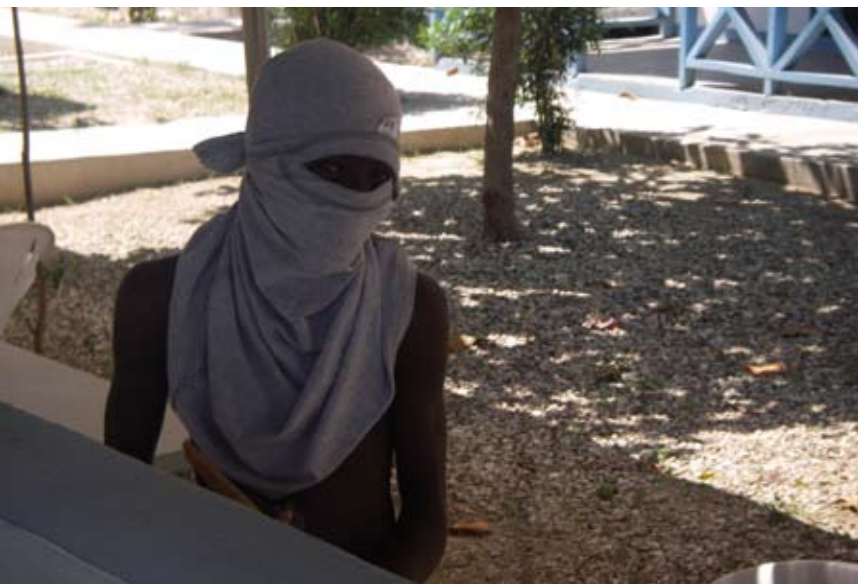
Crianças e adolescentes abandonados começam a praticar atividades delitivas ou criminosas em Porto Príncipe.