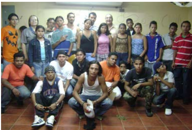
Oito mil jovens ex-integrantes de pandillas da Nicarágua já se beneficiaram dos programas que oferecem capacitação em cultura de paz.

estigmatização, desemprego, falta de oportunidades e um crescente tráfico de drogas e armas.