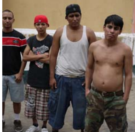
Cineasta faz documentário sobre as jovens pertencentes às maras da América Central para ONG que trabalha para a construção da paz.