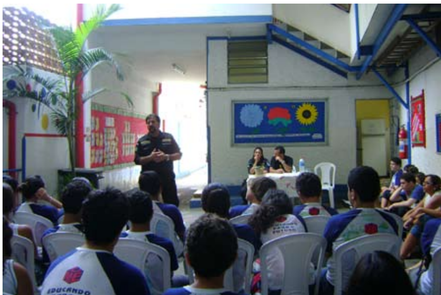
Policial bate um papo de responsa com alunos de uma escola de Niterói, no Rio de Janeiro.

grandes favelas do Rio, entre elas Vigário Geral.